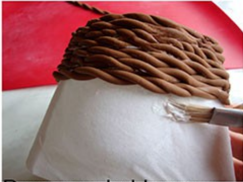
Damos cola blanca y pegamos rodeando todo el soporte