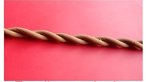
Enrollamos de dos en dos