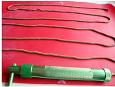
Haremos tiras de churritos