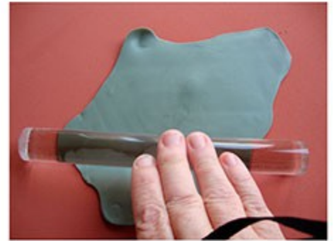
Estiramos masa teñida de verde