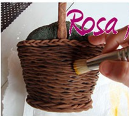
Daremos a pincel seco un color ocre con pinturas acrílicas