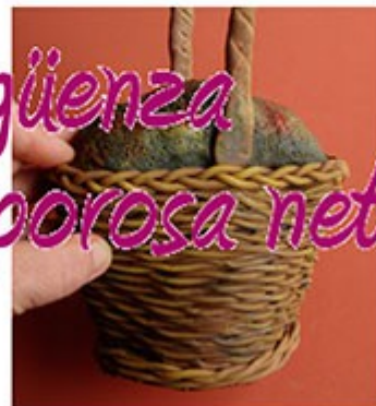
En la parte de arriba daremos toques con ocre y rojo a pinceladas sueltas