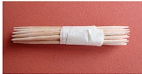
Con unos cuantos palillos nos hacemos esta herramienta para texturizar