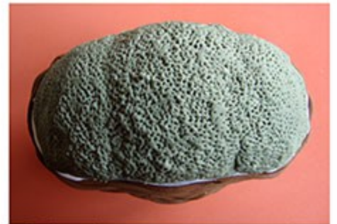
Pinchamos por todo Para dar esta textura