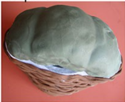
Forramos la base que hemos formado con la bola de porex