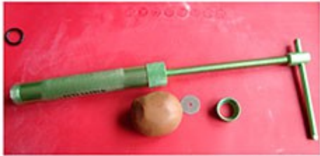
Masa teñida de marrón claro y extrusora